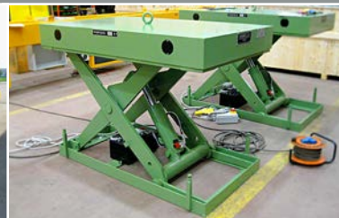
ALTRE ATTREZZATURE DI MOVIMENTAZIONE