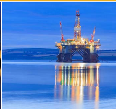
OIL & GAS