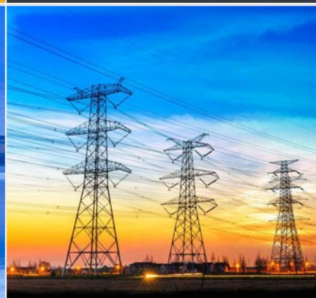
PRODUZIONE DI ENERGIA