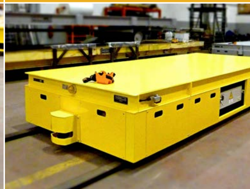
CARRELLI SEMOVENTI SU BINARIO MANUALI E AUTOMATICI