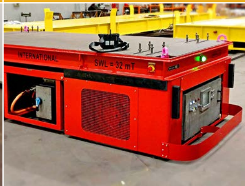
CARRELLI ATEX / IECX PER AMBIENTI ESPLOSIVI