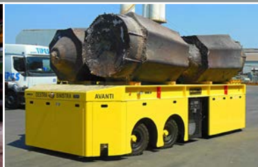
CARRELLI SEMOVENTI GOMMATI DIESEL