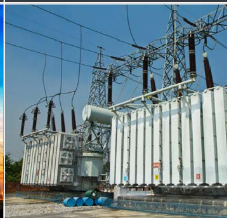
TRASFORMATORI DI POTENZA