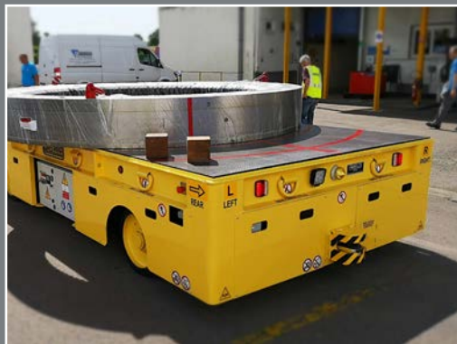
CARRELLI SEMOVENTI GOMMATI ELETTRICI A BATTERIA