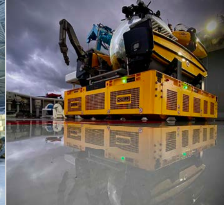
MARINO E CANTIERI NAVALI