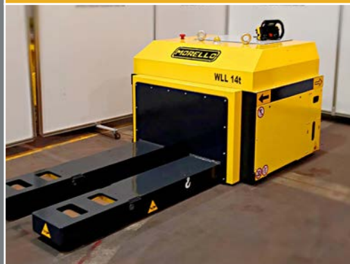
TRANSPALLET ELETTRICI GRANDE PORTATA