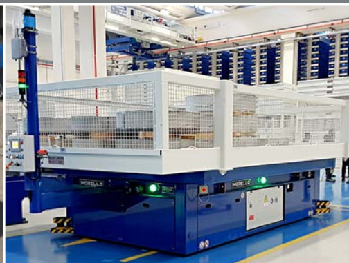
AGV / VEICOLI A GUIDA AUTOMATICA