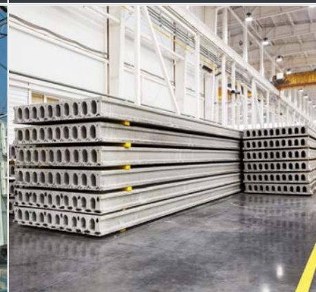
PREFABBRICATI IN CALCESTRUZZO